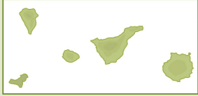
Pararge xiphioides (ondulada canaria)

Este endemismo canario tan solo existe en las islas centrales y occidentales del archipiélago. Es similar a Pararge aegeria , una especie muy común en la península ibérica y el resto del continente europeo, aunque pueden diferenciarse sin dificultad. Habita principalmente en entornos con cierta humedad, por lo que es una especie muy propia de la laurisilva.